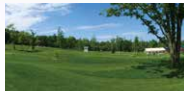
■ 小樽グリーンパーク (小樽市)