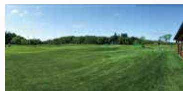
■ エルムパーク西の里 (北広島市)