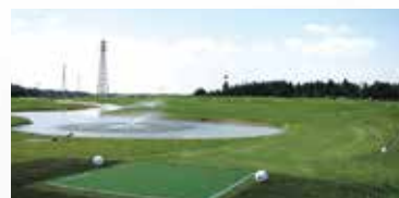
■ タケエイエコパークゴルフ大木戸(千歳県)