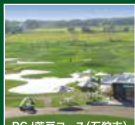
PGJ茨戸コース(石狩市) 当コースでも採用しております